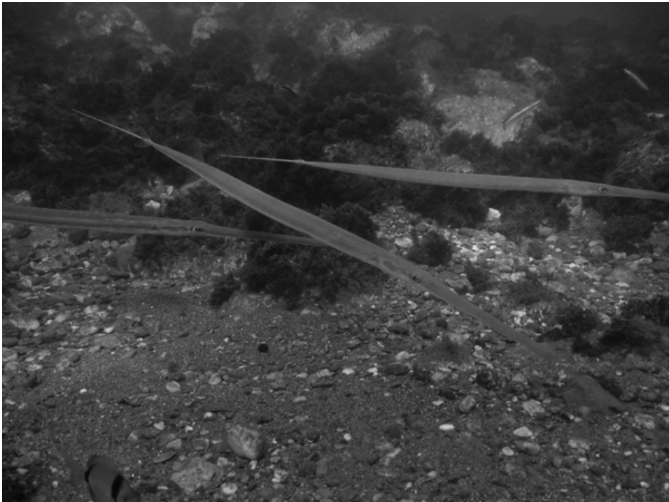
Fig. 2.—Tres ejemplares de Fistularia commersonii fotografiados en la Bahía del Berenguel a 5 m de profundidad en la interfase roca-arena.

La presencia Fistularia commersonii en aguas de la Península Ibérica, ya próximas al Estrecho de Gibraltar, siete años después de que se detectara su presencia en el Mediterráneo, nos da una idea de la capacidad y rapidez de colonización de esta especie, ya comentada por otros autores (Karachle et al. , 2004).