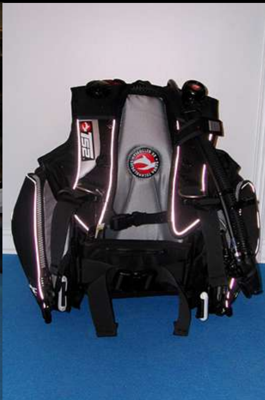
Jacket T52 de Tigullio