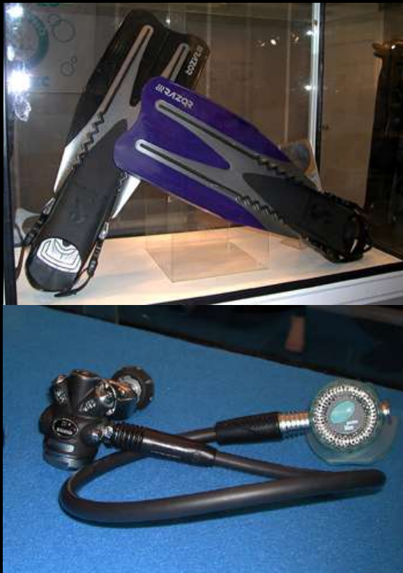
Aleta Razor de Scubapro