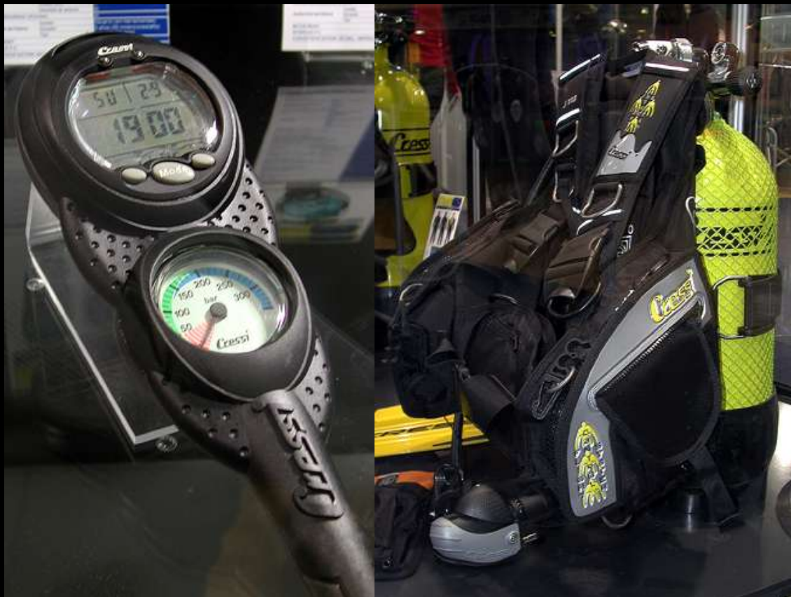
Control Flight System en chaleco J113 de Cressi

Cressi presentó muchas novedades, entre las que destaca la colección de chalecos, complementaria de la actual, que equipa su novedoso sistema de control de flotabilidad Flight Control System. FCS permite eliminar la traquea del hombro izquierdo y va situado en el perfil interior del chaleco. El mecanismo es muy ergonómico, recordando a los joysticks de las videoconsolas, fácil y agradable de coger y manipular. Los complementos de los chalecos han evolucionado, y también estaba presente el nuevo C-Trym System, el sistema de lastre integrado. Rondine A, aleta de última generación con un diseño de alta calidad, el traje modular Lontra 2, el monopieza Logica, el semiestanco Condor, nuevas combinaciones del modular Castoro y una versión reducida de la consola Archimede eran algunas, no todas, de las novedades que pudieron ver los visitantes.