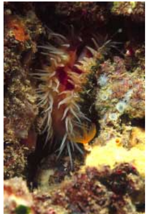
Chlamys varia. Esp: Almeja común

El tercer recorrido, que sin duda es el más conocido por todos, transcurre por el cañon principal, el cual iremos dejando a nuestra izquierda e iremos buceando por encima de las rocas. Prestad mucha atención a los agujeros y recodos de las rocas ya que es donde generalmente se esconden los congrios y las morenas. Una vez hayamos alcanzado la profundidad de -14mt. encontraremos una gran piedra en forma de pico y detrás de ella un desnivel con fondo de arena donde está situada la Cueva de Navidad . Este recorrido contempla muchas variantes sin tener que deshacer el recorrido admirado. Por tanto, que cada uno finalice la inmersión tomando