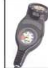
Manómetro + compás