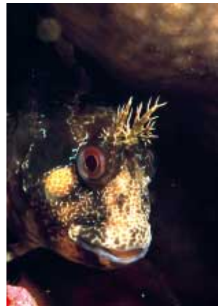
Parablennius Gattorugine. Esp: Burrito

Texto y fotografías: David Gil Ferrerons