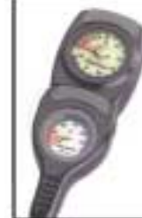
Manómetro + profundímetro analógico