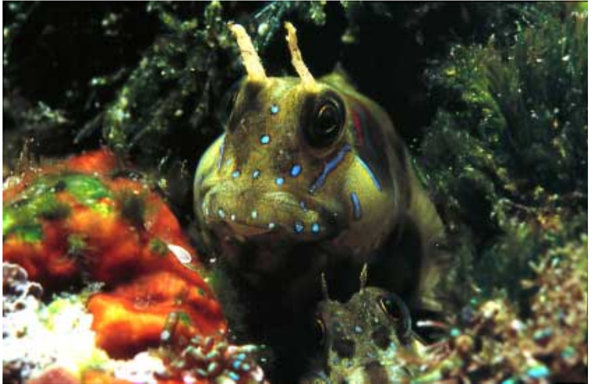
Aydablennius Sphynx. Esp: Dormilón de roca

Si por otro lado, tomamos el desvío que nos queda a nuestra izquierda, nos dirigiremos a hacia la zona de Ses Illes, siendo ésta inmersión de poca dificultad por transcurrir a poca profundidad. Bucearemos entre grandes bloques de roca y aguas muy claras. El punto más interesante y en el que debemos poner una especial atención es cuando encontremos una chimenea circular, de unos 2,5mt. de diámetro y de una altura aproximada de 4mt. La particularidad que tiene es que podemos introducirnos por su base y salir por su parte superior. Finalmente sólo tendremos que deshacer el camino para regresar.