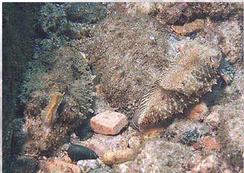
Dos sepias en pleno cortejo nupcial. Se observa que el macho (a la derecha) muestra un patrón de color cebrado hacia la hembra (izquierda)

La víctima suele ser capturada por los brazos largos y llevada a la boca, donde es retenida por los ocho tentáculos cortos mientras es devorada con sus afiladas mandíbulas. Si la presa no está al alcance directo de sus tentáculos, la sepia muestra una onda de color que recorre su piel y co-