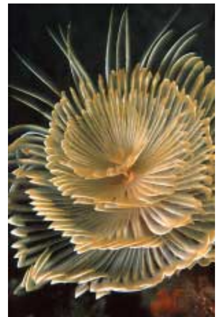
Spirographis Spallanzanii. Esp: Espirógrafo