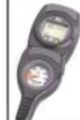
Manómetro + ordenador