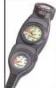
Manómetro + profund. analóg + compás