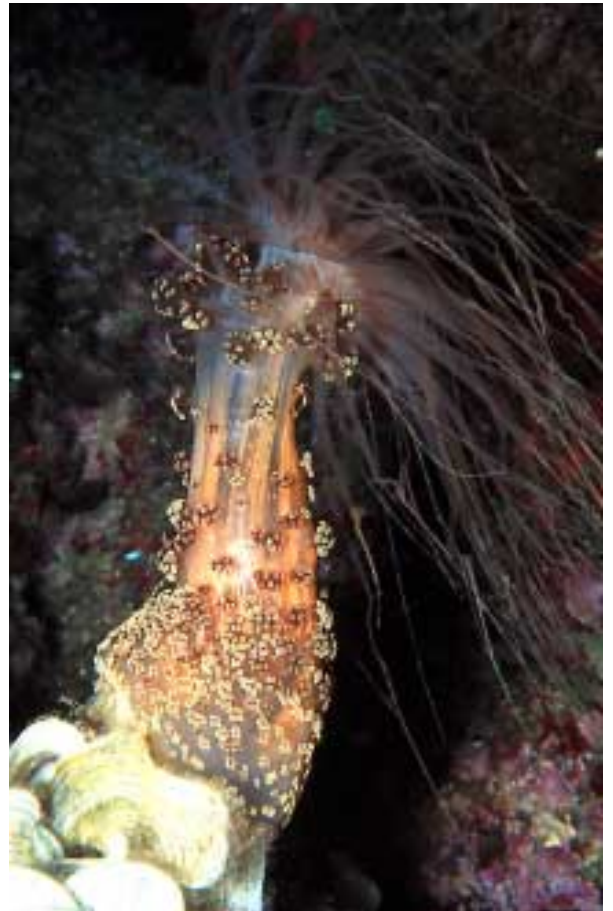
La rara «Alicia Mirabilis» en todo su esplendor

Habréis disfrutado de una inmersión lo bastante paisajística para ser comentada entre vosotros por lo que os aconsejo que la dejéis para los días con buena visibilidad ya que en caso contrario aumenta la dificultad de la inmersión, sobretodo por lo que respecta a la orientación.