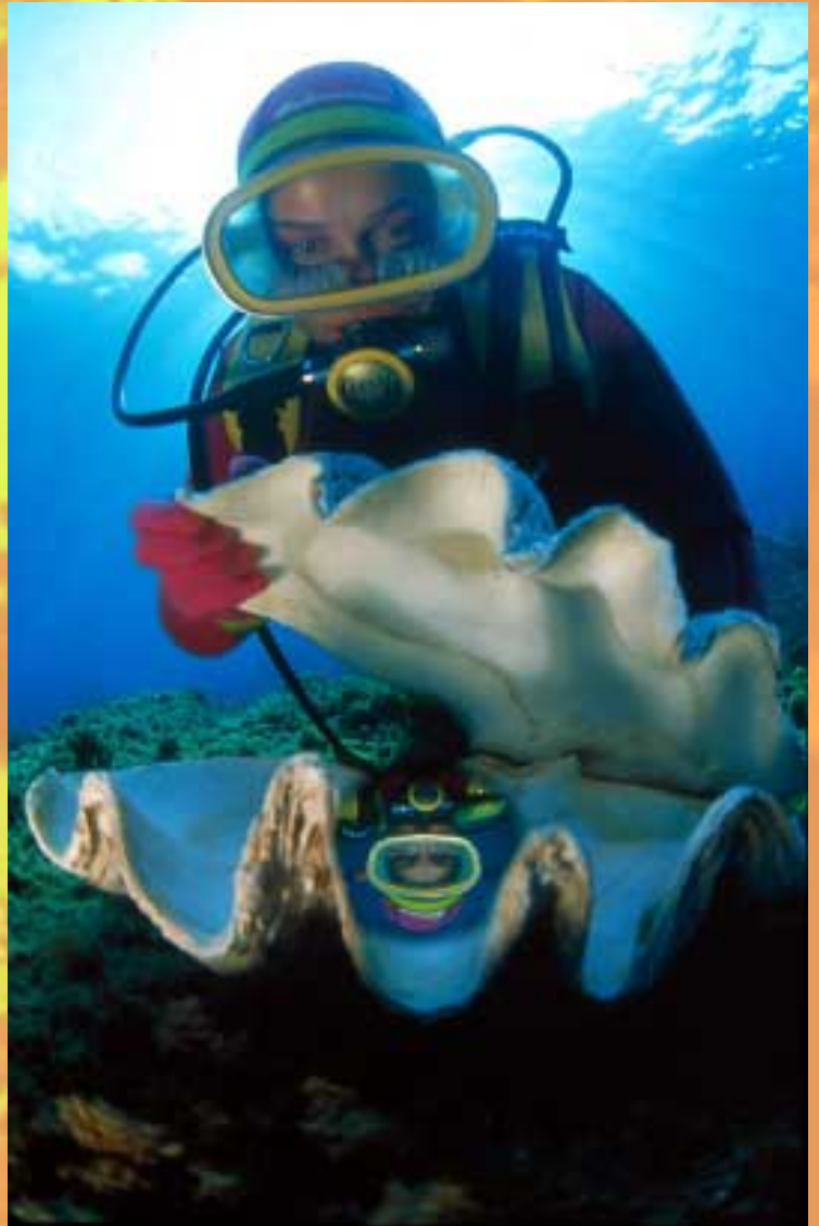
2º José Luis González – Mejor Fotografía Creativa