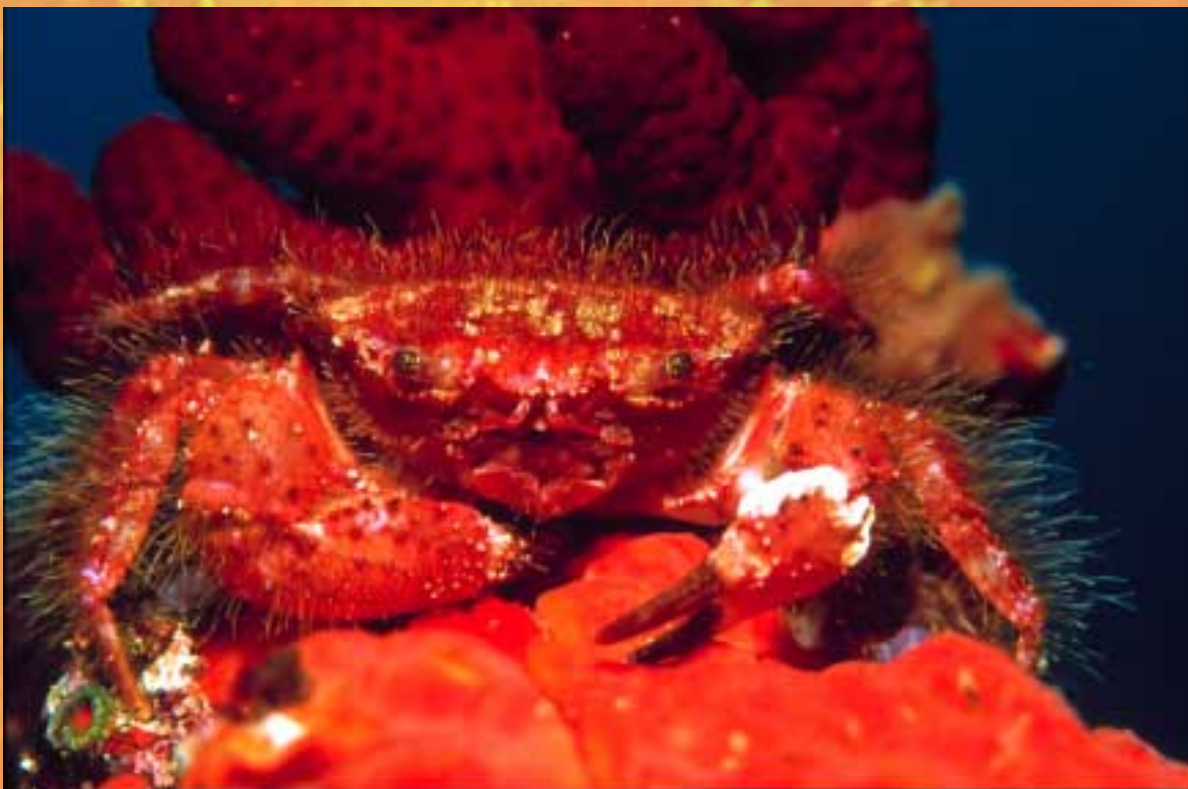
3º Jorge Juan Candán – Mejor Fotografía Macro