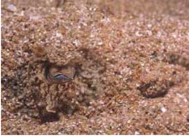
Una sepia perfectamente mimetizada en la arena, al acecho de una presa

La sepia es un cefalópodo decápodo que puede llegar a alcanzar un peso de 2 kilos y una longitud de 65 centímetros, de los cuales el manto, sin cabeza ni brazos, puede llevarse unos 35. El cuerpo es aplanado y está rodeado por una cresta cutánea que emplea para nadar mediante ondulaciones sincronizadas.