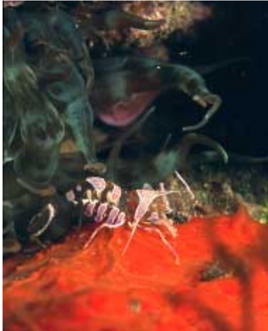
Periclimenes Amethysteus. Esp: Quisquilla de anémona

cualquiera de los recorridos alternativos.